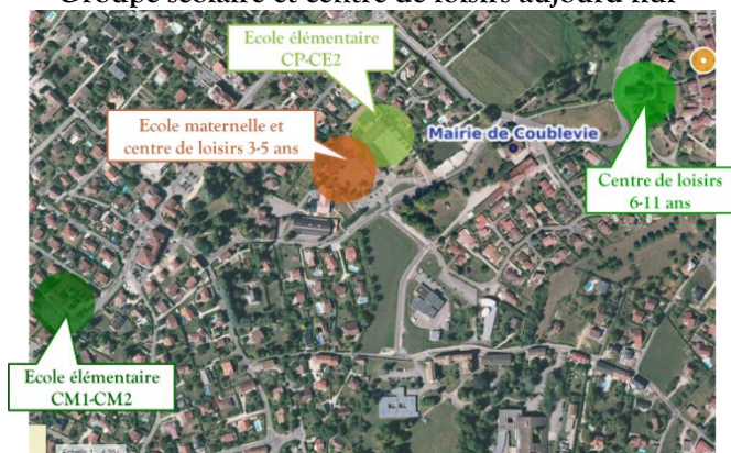
Groupe scolaire et centre de loisirs aujourd'hui