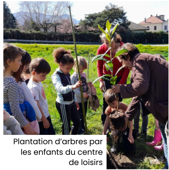
Plantation d'arbres par les enfants du centre de loisirs

Couple'fruits crée du lien entre les habitants.