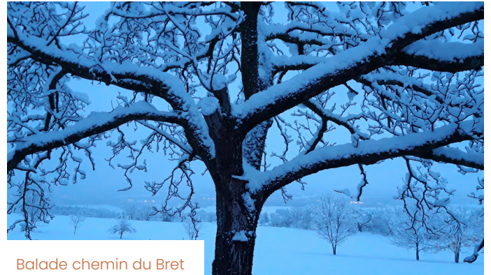
Balade chemin du Bret

Pour information : la MFR organise également des journées d'information les 4 et 5 mars 2022.