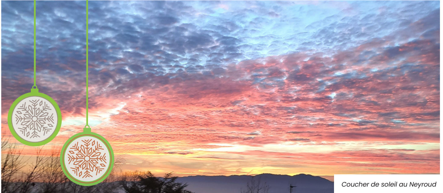
Coucher de soleil au Neyroud

Journal d'information mensuel de Coublevie Janvier 2023