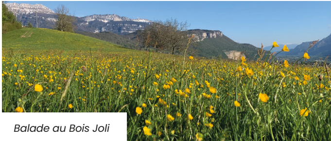
Balade au Bois Joli