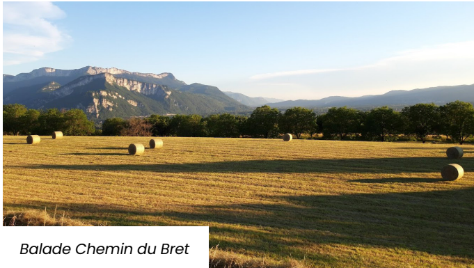
Balade Chemin du Bret