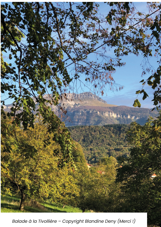
Balade à la Tivollière - Copyright Blandine Deny (Merci !)