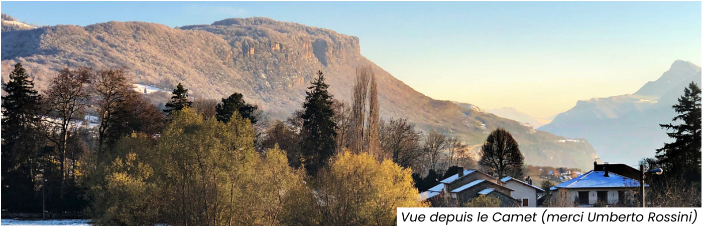
Vue depuis le Camet (merci Umberto Rossini)

Journal d'information mensuel de Coublevie Janvier 2024