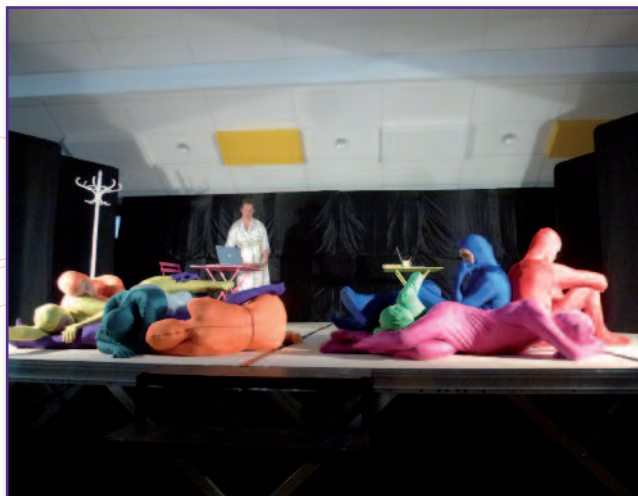
M'Organes de Toi

Le 2 juillet 2017, tous les adhérents et tous les présidents qui se sont succédés au fil des années ont été conviés pour fêter les 10 ans de l'Association, fête qui a eu lieu à la salle communale de Coublevie.