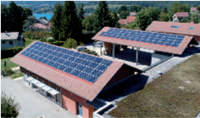
Billieu, École le petit prince 36 kW

La maison Laurent et la salle socio-Éducative de la Buisse. L'école de Billieu.