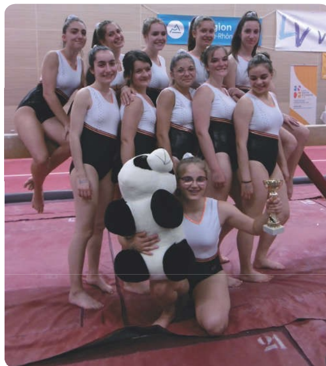
du podium devant 19 concurrentes.