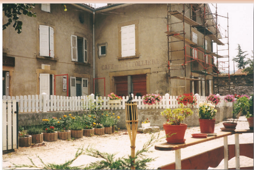
Café épicerie Martin Vallet

L'épicerie et le café ont été ouverts bien avant la guerre de 14-18. Mon beau père et son épouse, sa mère et sa grand-mère ont tenu ce commerce qui fermera en 1980. L'épicerie avait des rayons bien garnis avec toutes sortes de choses. Elle a tourné à plein régime jusqu'à la fermeture. Ma belle mère servait au magasin et s'occupait du café. Ses journées étaient de 12h minimum. Mon beau père faisait les tournées en camionnette : Etang Dauphin, Tolvon, St Julien de Ratz, Grand Ratz, et à Coublevie le Neyroud, le Massot, le Bouvier. L'épicerie était un lieu de rencontre pour les dames de la Tivolière. Au café, il y avait beaucoup de monde le samedi et le dimanche. Les Voironnais venaient jouer aux boules (à la longue). Nombreux étaient les pots de vin qui circulaient ! Une fois vides ils étaient posés sur le rebord de la fenêtre du café, en attente de remplissage, ce qui ne tardait pas ! Les joueurs buvaient pendant et entre les parties. Leurs femmes les rejoignaient dans l'après-midi avec les enfants. Elles se promenaient, bavardaient et buvaient une limonade. Le soir on servait omelette et tomme fraîche. En semaine, c'était surtout les habitués de la Tivolière. Quand le café était fermé le lundi, les habitués venaient quand même boire un verre, mais à la cuisine.