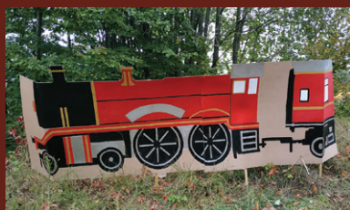
VSB réalisé par le Sou des Écoles