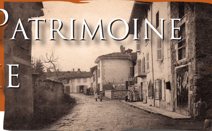
Quartier de la Tivolière au début du 20 ème siècle