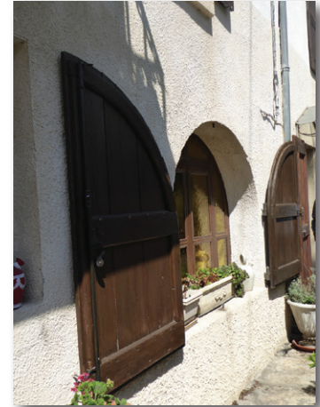
Ancienne Épicerie Limone aujourd'hui