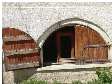
Ancien commerce de « tri sur le volet »

Deux voies de communication traversent la Tivolière :