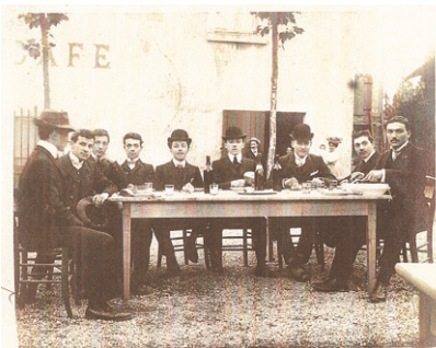
Café Ma Campagne - 1925