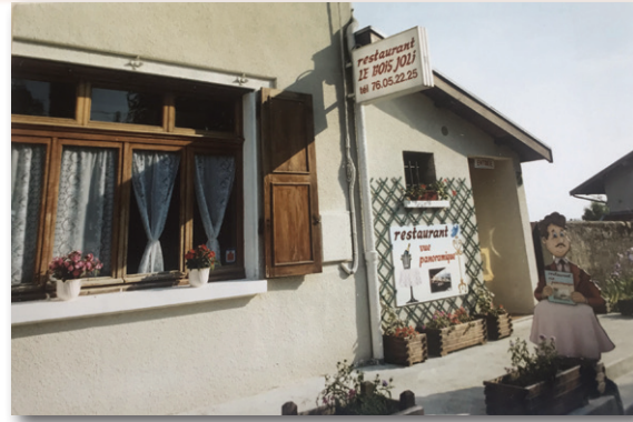
Restaurant Le Bois Joli - Fin des années 80