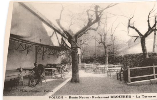
Restaurant Brochier en 1930