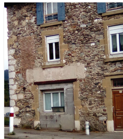
Ancien café Beauséjour aujourd'hui

C'était ma grand-mère qui le tenait. Les hommes venaient jouer aux cartes au 500 ou à la manille. A la mort de ma grand-mère, c'est ma tante Pommiers qui l'a repris jusqu'en 1940.