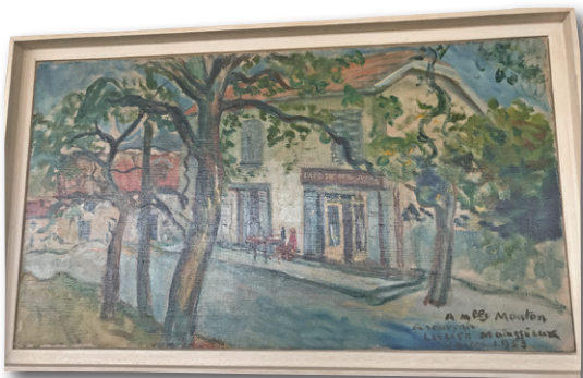
Restaurant Le Bois Joli par Lucien Mainssieux (coll.privée)