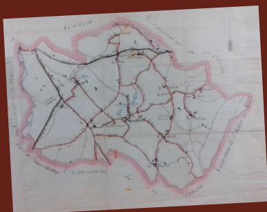
Ancien plan 1870

Christophe Jayet-Laraffe Groupe Histoire et Patrimoine