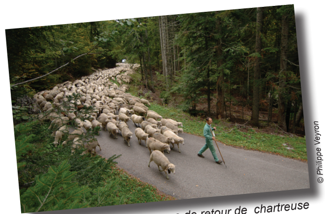
Transhumance de retour de chartreuse